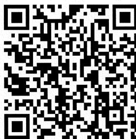
(AI 就业实训基地院校合作二维码)

(四) 活动主办单位和各承办单位要广泛动员跨境电商产业相关用人单位发布岗位信息, 并做好信息审核, 坚决杜绝虚假招聘等违法行为, 切实维护高校毕业生就业权益。